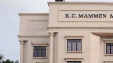
K.C. MAMMEN MAPPILLAI HALL

കോട്ടയം : നോർത്ത് അമേരിക്കയിലെ കേരളീയരുടെ സംഘചേതനയുടെ പ്രതീകമായ ഫെഡറേഷൻ ഓഫ് മലയാളി അസോസിയേഷൻ ഓഫ് അമേരിക്ക (ഫോമ)യുടെ ‘കേരള കൺവൻഷൻ 2012’-ന് അക്ഷര നഗരിയായ കോട്ടയം ഒരുങ്ങുന്നു.